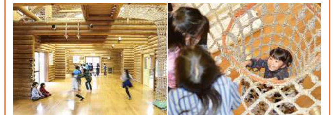
ログハウスの造りは4カ所共通