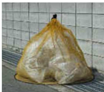
ごみネット（ドーム型）