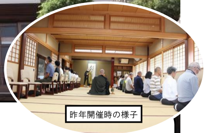
昨年開催時の様子

【日 時】:令和6年6月14日(金)9時30分~11時(集合:なでしこ公民館に8時50分)