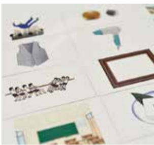
言語訓練に使う絵カード

「言葉が失う」「口からご飯を食べられなくなる」というのは、相当な精神的ダメージを受けますし、その人の人生を左右してしまいます。市民病院は病気やけがをして間もない方や、病状が安定せず集中的な医療を要する方に対応する急性