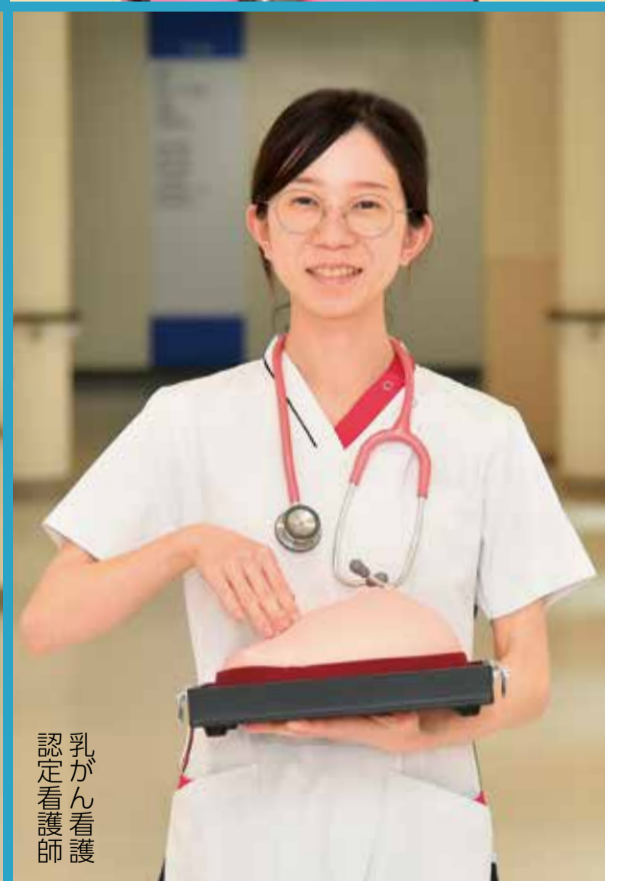
乳がん看護認定看護師