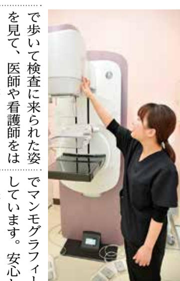
優しいピンク色の壁が特徴のマンモグラフィー検査室

放射線技師が撮影した画像は病気の発見や治療方針の決定に必要なものです。先日、外来で撮影にいられた患者さんは、以前重症の状態入院されていた方だった時、診断に必要な画像を私が撮影させてもらいました。重症の状態だった方が、回復されてご自身