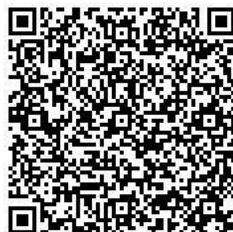
申込フォームはこちらから