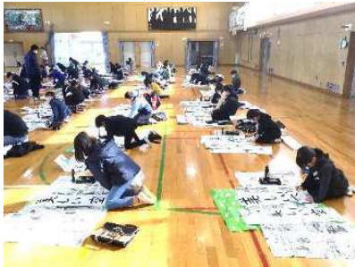
1/12 書き初め (4年生の様子)