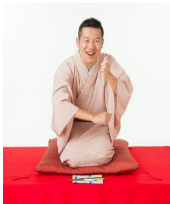
講師：林家 木久蔵 氏 (はやしや きくぞう)