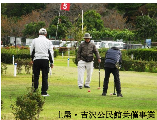
土屋・吉沢公民館共催事業