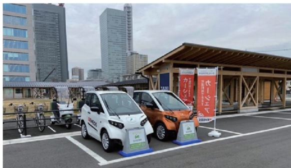
電動アシスト自転車、スクーター、超小型EVのシェア型マルチモビリティステーション (さいたま市)