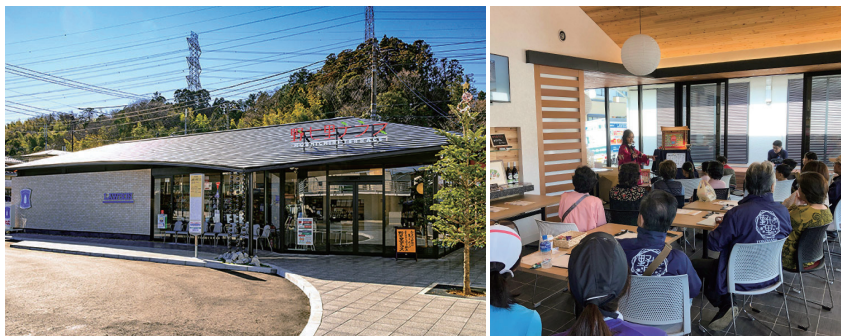
バス停に整備された交流スペース併設コンビニ「野七里テラス」 (横浜市栄区)