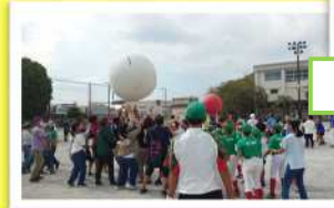
大人も子どもも白熱!

今年は参加できなかった方も来年はぜひご参加ください! (市民体育レクリエーション八幡地区大会実行委員会)