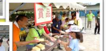
地域の方・神明中学生徒も 運営ありがとうございました