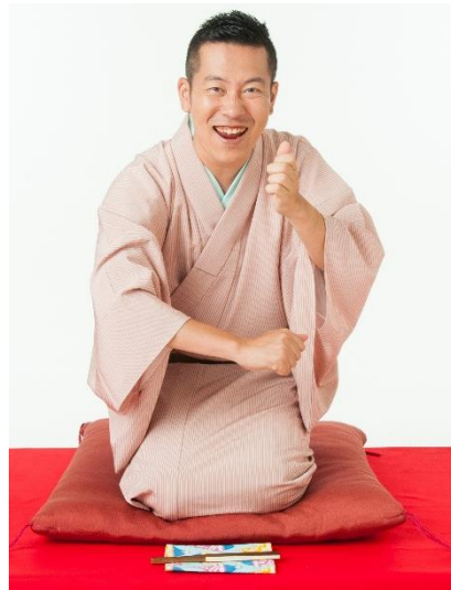
講師: 林家 木久蔵 氏 (はやしや きくぞう)

国民的番組のレギュラーでおなじみ、林家木久扇さんを父に持ち、落語家として活躍されている林家木久蔵さん。父親の木久扇さんとのエピソードや、子育てにがんばる親に向けてご自身の経験を交えて語っていただきます。