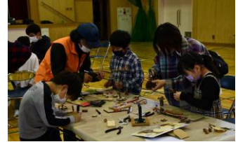
秋の自然に触れてみませんか