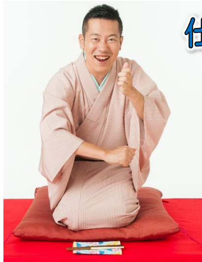
講師：林家 木久蔵 氏 (はやしや きくぞう)