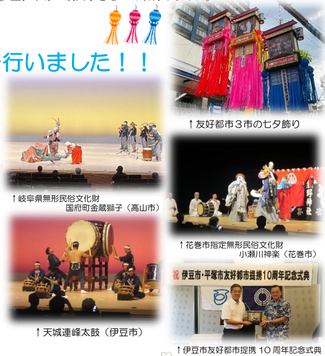
↑友好都市3市の七夕飾り

また、花巻市と伊豆市では市民ツアーが実施され、大勢のツアー客が訪れました。今年は伊豆市との友好都市提携10周年の記念の年でもあるため記念式典を行い、両市の絆を再確認しました。