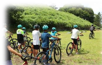
↑MTBやロード体験！楽しい◎(伊豆市)