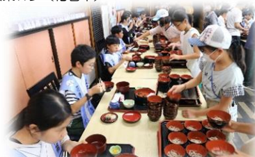
↑わんこそば大会は、大盛り上がり♪(花巻市)