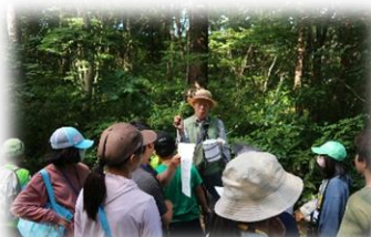
↑みんなで楽しく自然散策☆(花巻市)

初めて会う友好都市の友達とたくさん遊び、たくさん学び、貴重な経験となったようです。友好都市のみんな、今度は平塚市にも遊びに来てね～！