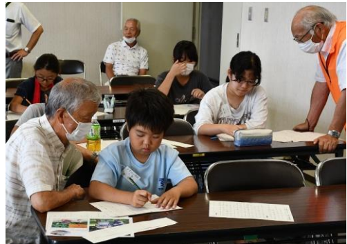
講師の金目エコの皆さんと悩みながら 素敵な作品ができました！！