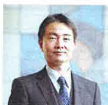
成本 迅 氏