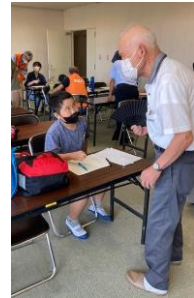
俳句作りにチャレンジ!