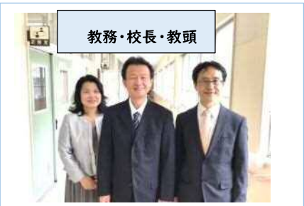
教務・校長・教頭

このほか、スペースの関係で載せられませんが、図書館司書、サンサンスタッフ、介助員、AETなどのスタッフがあります。ボランティアの方々にも力をお借りしながら、温かな学校をつくっていきます。