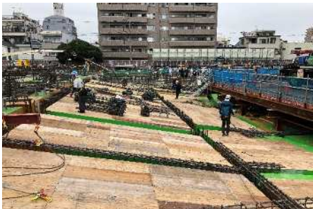
大ホール 1 階客席床型枠・梁配筋状況