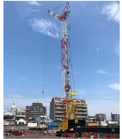
クローラクレーン