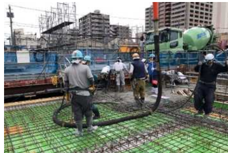
1 階床スラブコンクリート打設状況