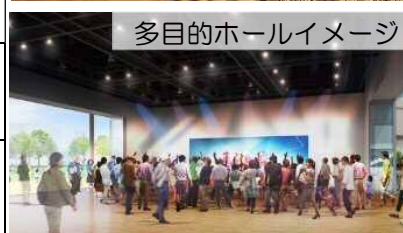
多目的ホールイメージ