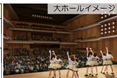
大ホールイメージ