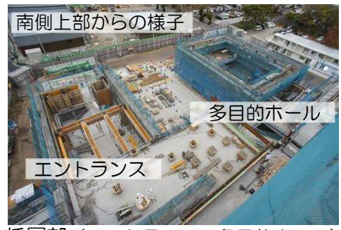
低層部（エントランス、多目的ホール）