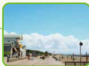
湘南ベルマーレひらつかビーチパーク by shonan zoen