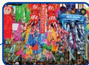
湘南ひらつか七夕まつり