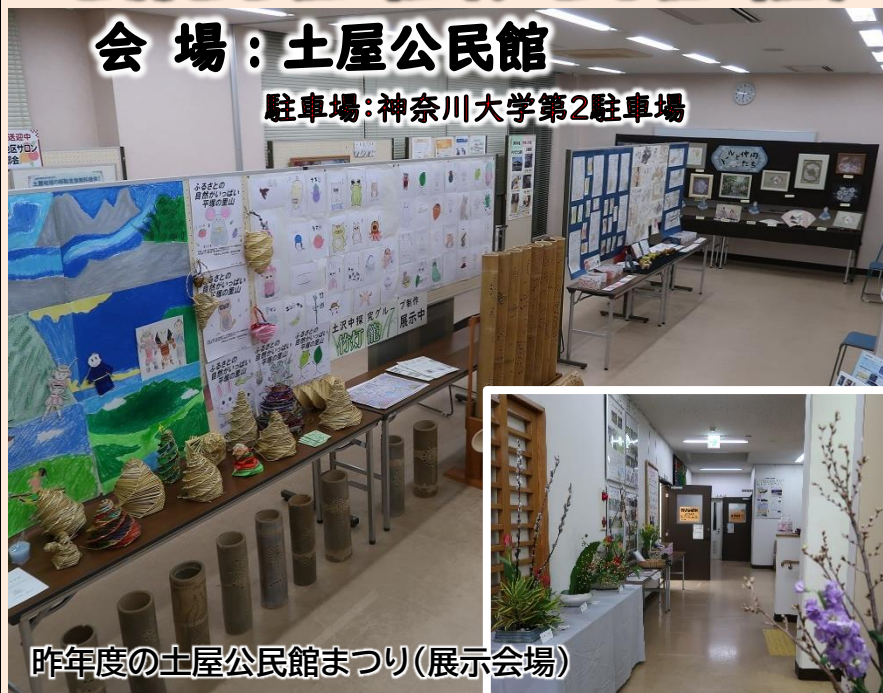
昨年度の土屋公民館まつり(展示会場)