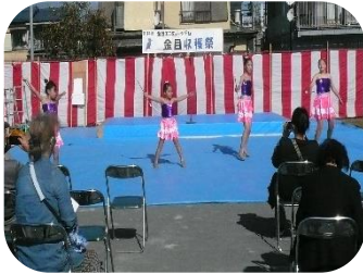
平塚バトンクラブ