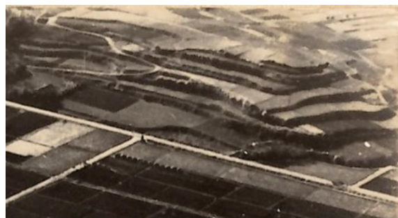
広川五領ヶ台 周囲に家、木々は無く段々畑となっている。 (撮影昭和29年)