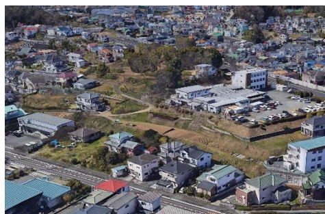
現在の五領ヶ台(グーグルアースより) 昭和47年国指定史跡(貝塚)となる。 現在企業の研究所が建ち、周辺は家が密集し木々が生い茂り、公園として住民の憩いの場となっている。