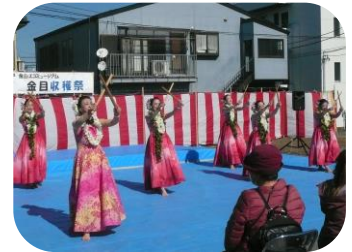
ケ・オルマニオ・マウナロア