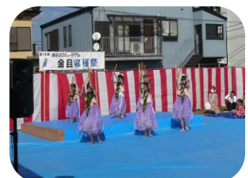
ハーLOW・アロアロウラ