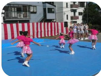
SUN マーチングスクール 湘南ファティーナ