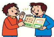
コミュニケーションボードによる会話