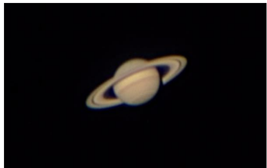
↑ 講師の関谷さん FB より