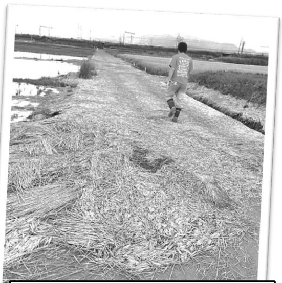
農道に流出した稲わらの様子