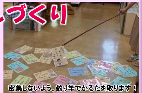
密集しないよう、釣り竿でかるたを取ります!

「弦斎食育かるた」で遊びながら、レシピ集に紹介されている「ワッフル」作りにチャレンジします! その他、土屋で採れたさつまいもを使い、付け合わせや梅干し和えも作ります! 親子で一緒に遊びながら、楽しく食育を学びましょう!