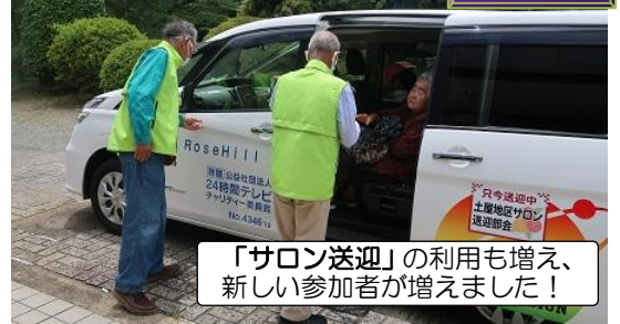
「サロン送迎」の利用も増え、新しい参加者が増えました!

参加していただいた皆さん、企画会議から当日の運営までご協力いただいた福寿会役員の皆さん、本当にありがとうございました。