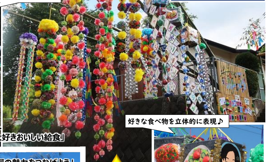
好きな食べ物を立体的に表現♪