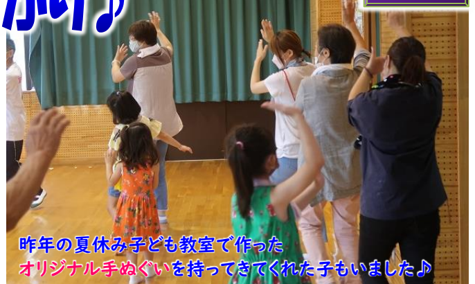
昨年の夏休み子ども教室で作ったオリジナル手ぬぐいを持ってきてくれた子もいました♪