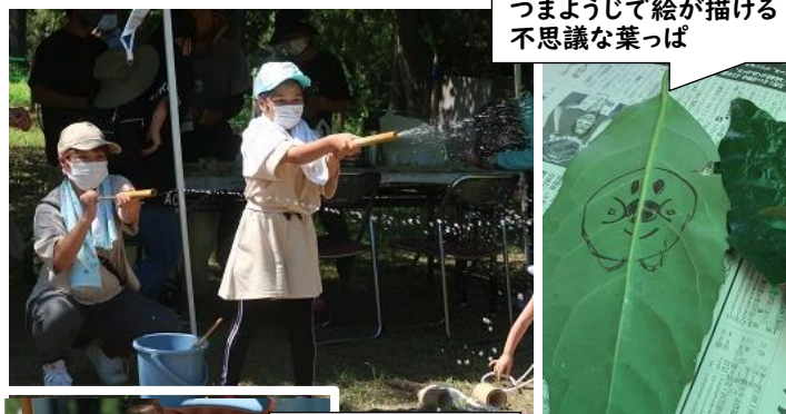
つまようじて絵が描ける不思議な葉っぱ

七国荘を会場に、里山をよみがえらせる会の皆さんが作ってくれた竹のおもちゃを使い、いろんな昔あそびで盛り上がりました!