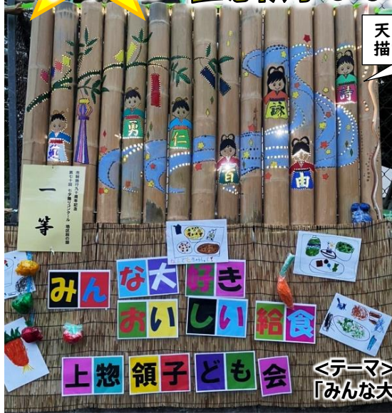
天の川と子ども達を描いた竹灯籠