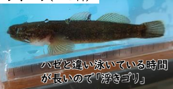
ハゼと違い泳いでいる時間が長いので「浮きゴリ」