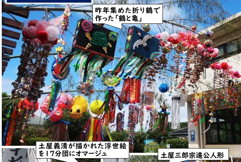
昨年集めた折り鶴で作った「鶴と亀」