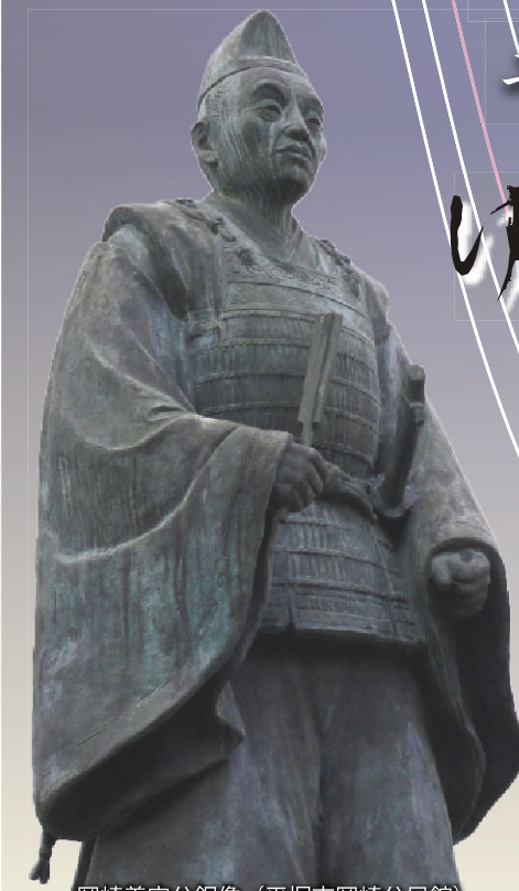
岡崎義実公銅像 (平塚市岡崎公民館)

このリーフレットを手に、七人にまつわる史跡を訪ね、地域の歴史ロマンに思いをはせてみてはいかがでしょうか。