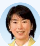
江口 友子 議員