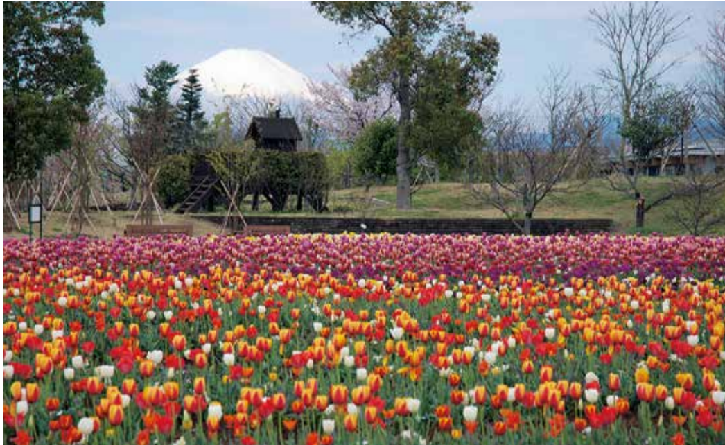
「花菜ガーデンのチューリップ」 (撮影日 令和4年4月6日)

そのため、当初予算は、総合計画改訂基本計画の推進を基調としつつ、新型コロナウイルス感染症の影響を踏まえた施策の展開とし