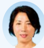
石田 美雪 議員