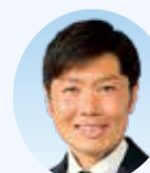
渡部 亮 議員