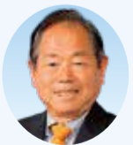
野崎 審也 議員