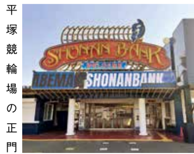
平塚競輪場の正門