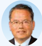
石田 雄二 議員