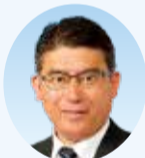
秋澤 雅久 議員