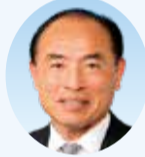
山原 栄一 議員