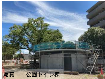
写真 公園トイレ棟