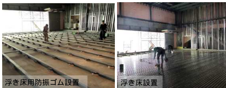
浮き床用防振ゴム設置

多目的ホールは、防音・遮音性能に優れた浮き床構造となっています。また、見附台公園やエントランスホールと一体的に使用するための大型の建具等の取り付け工事を進めています。