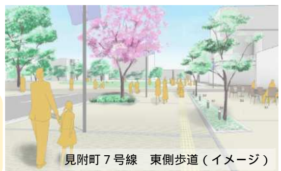
見附町 7 号線 東側歩道 (イメージ)