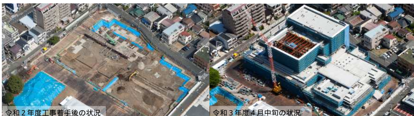
令和2年度工事着手後の状況

工事着手から約1年経過し、外観がはっきりしてきました。躯体のコンクリート打設も概ね完了し、外壁塗装工事、内装工事や設備工事等のさまざまな工種の作業を進めています。ここで、工事の一部をご紹介します。