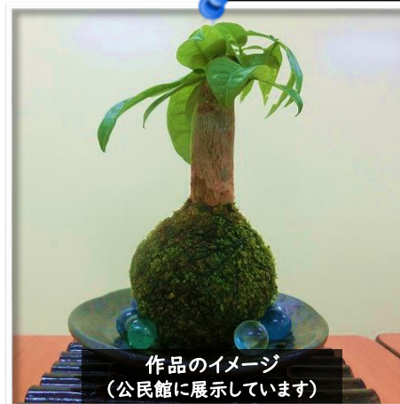
作品のイメージ (公民館に展示しています)

※苗木は別のものになる可能性があります。また、器以外の装飾品は参加費に含まれていません。