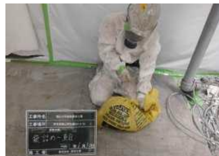
除去材は法令で定められた指定の袋に入れます。