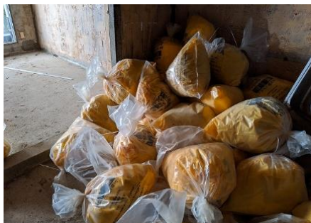
透明の袋に入れ2重梱包し敷地内の住戸に一時保管します。