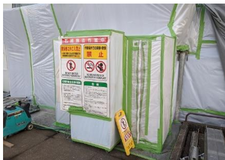
アスベスト除去箇所をシートにて養生します。