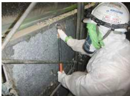
アスベスト含有塗材を鉄のへら等で除去します。