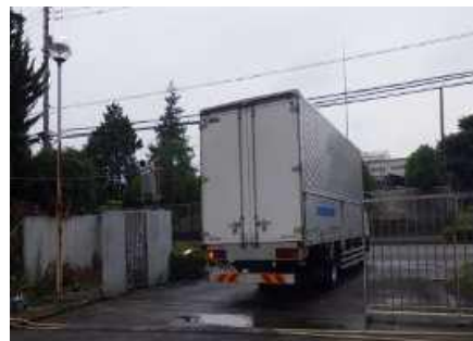
仮置き場から搬出用車両により除去材を搬出します。

解体工事中、近隣の皆様方には何かと御迷惑、御不便をおかけいたしますが、アスベスト除去作業をはじめ、騒音、振動、粉塵等の防止につきましては万全を期しますので、工事への皆様方の御理解と御協力を賜りますようお願い申し上げます。