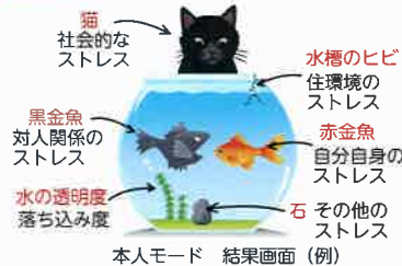
本人モード 結果画面 (例)

こころの体温計 ご利用にあたって ・利用料は無料です。(通送料は、自己負担となります。)個人が特定されるような情報の入力は一切不要です。 ・自己診断をするもので、医学的診断をするものではありません。 ・結果にかかわらず、心配なことが続くようでしたら、早めに専門家にご相談されることをおすすめします。