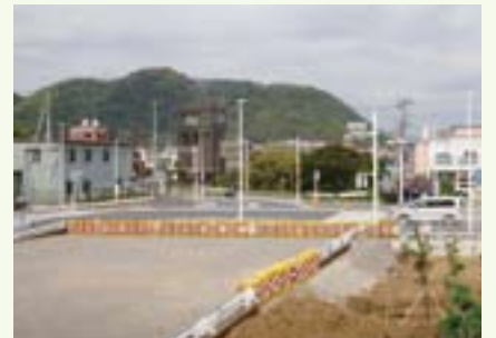
花水川河口の西岸、現在の「唐ヶ原」交差点

では「もろこしが原」とはどの辺を指すのでしょうか。更級日記では「二三日行く」と記していますから、かなり広い範囲と思われる。17世紀に編纂された「新編鎌倉志」の挿図には、江の島に近い境川河口の東岸に「唐原」という地名が記される一方、江戸時代の国絵図では花水川の東岸に「唐が原」の記載がありますから、この間の海沿い地域を広く「もろこしが原」と呼んでいたのかもしれない。確かに江の島を挟んで東側の砂浜は砂鉄を多く含んで黒っぽく、それに比べると西側の砂浜は白っぽく見えます。ただこの地域が大陸の国々を意味する「もろこし」と呼ばれるようになった背景にはやはり、朝鮮半島からの移住者たちが暮らし、「高麗」の地名を今に伝える花水川河口周辺の文化にその源が求められるのではないのでしょうか。