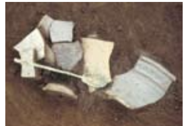
佐波理匙の出土状況（匙全長26.4cm）

山王A遺跡は四之宮の相模国府推定地内にあります。建物の柱の脇に丁寧に匙を置いた出土状況から、建物の安全や魔除けを祈願した地鎮と考えられ、寺院または役所などの重要な建物であることが示唆されます。