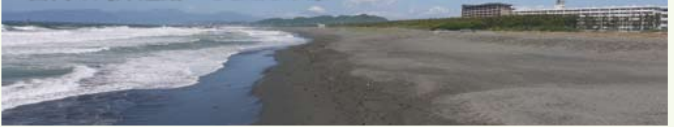
平塚海岸の景観 西方の高麗山、富士を望む

もろこしが原といふ所も、砂子のいみじう白きを二三日行く。「夏はやまなでこの濃く薄く錦をひけるやうになむ咲きたる。これは秋の末なれば見えぬ」といふに、なほ所々はうらこぼれつ、あはれげに咲きわたれり。もろこしが原に、やまとなでしも咲きけむこそなど、人々をかしかる。