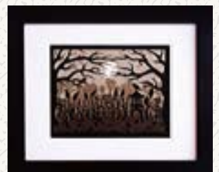
アンジー・ピックマンさん制作の 記念品（切り絵）

アンジー・ピックマンさんHP http://ruralpearl.com/blog/