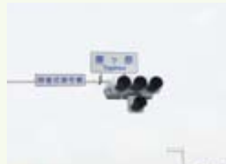
今では「とうがはら」という呼び方が定着しています。

幕府が編纂した「新編相模国風土記稿」の片瀬村の項には「鎌倉より大磯驛に達せし古道は海濱にあり」と記されています。近世には確かに浜辺の交通路が認識されていたのです。現代とは異なり道路事情が良くなかった古代において、雑草が生い茂ることのない海岸の波打ち際が維持管理のいらない便利な交通路であったことは容易に想像できます。