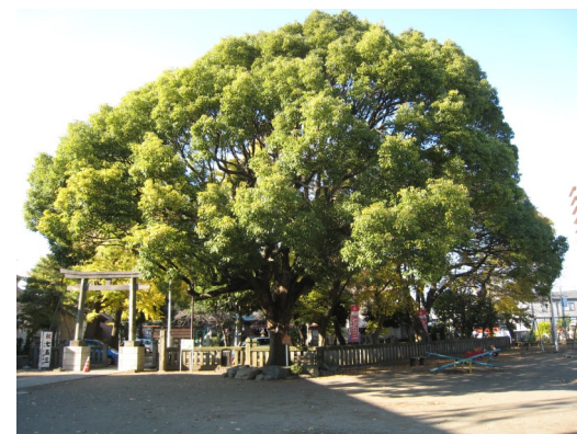
指定番号82番 平塚三嶋神社のくすのき