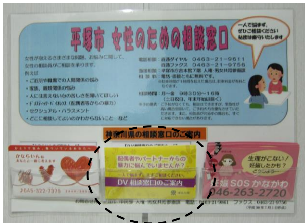
「DV相談窓口のご案内」カード