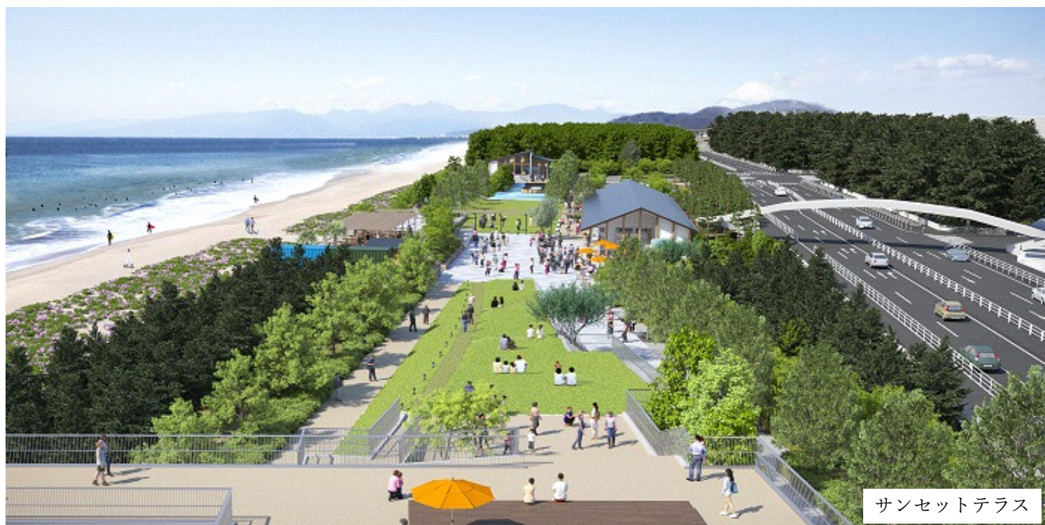
サンセットテラス