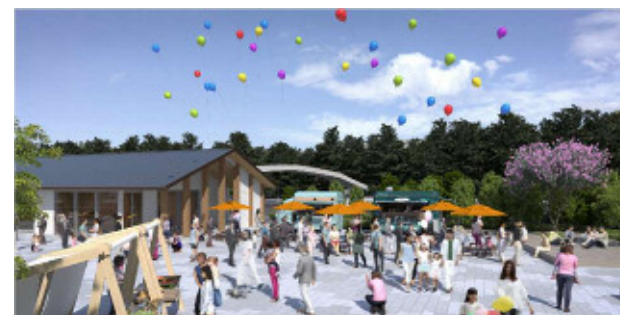
イベントプレイス