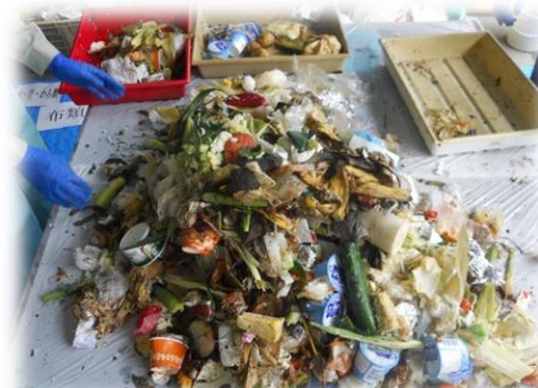
【写真】食べ残し・調理くずの状況