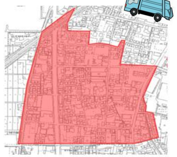
大神第四自治会の地域

可燃ごみ戸別収集の社会実験に関するお問い合わせ 社会実験のモデル地域内の収集、ごみ置き場に関すること ・環境部収集業務課 電話：21-8796、FAX：36-2352、メール：shigen-j@city.hiratsuka.kanagawa.jp 社会実験の制度設計に関すること ・環境部環境政策課 電話：21-9762、FAX：21-9603、メール：kankyo-s@city.hiratsuka.kanagawa.jp