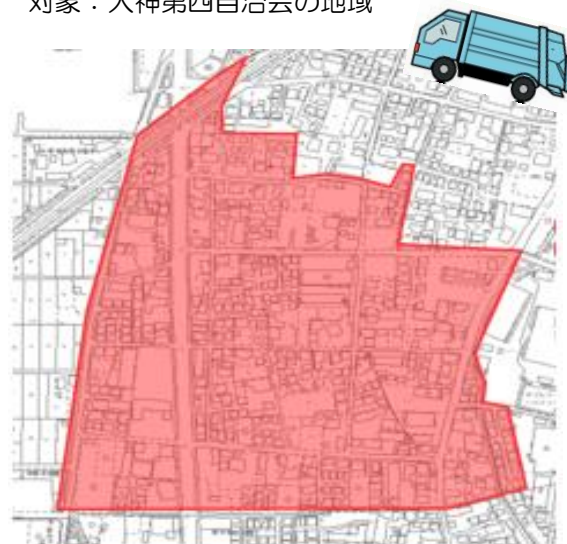
大神第四自治会の地域

可燃ごみ戸別収集の社会実験に関するお問い合わせ 社会実験のモデル地域内の収集、ごみ置き場に関すること ・環境部収集業務課 電話：21-8796、FAX：36-2352、メール：shigen-j@city.hiratsuka.kanagawa.jp 社会実験の制度設計に関すること ・環境部環境政策課 電話：21-9762、FAX：21-9603、メール：kankyo-s@city.hiratsuka.kanagawa.jp