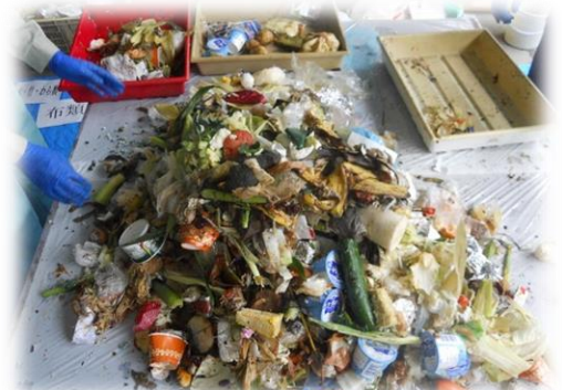
【写真】食べ残し・調理くずの状況