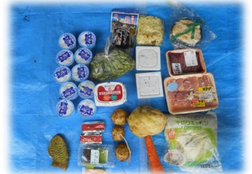
【写真】食品の直接廃棄の状況