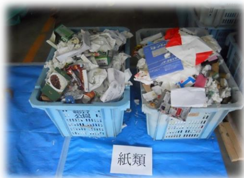
【写真】再生可能な紙類の混入状況

可燃ごみ量の削減のため 『食品ロスの削減』と 『資源再生物の分別』に 御協力ください