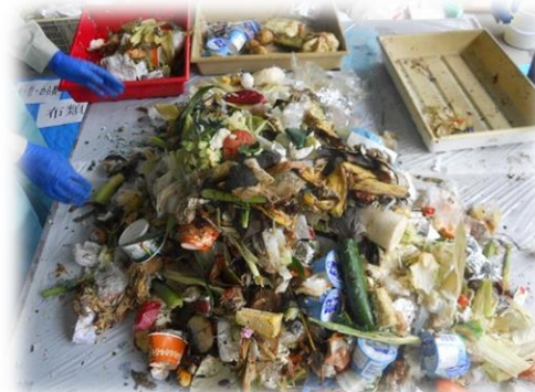
【写真】食べ残し・調理くずの状況