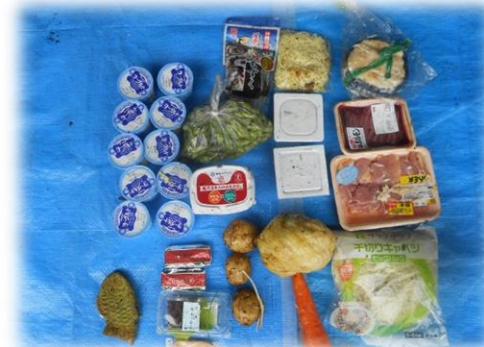
【写真】食品の直接廃棄の状況