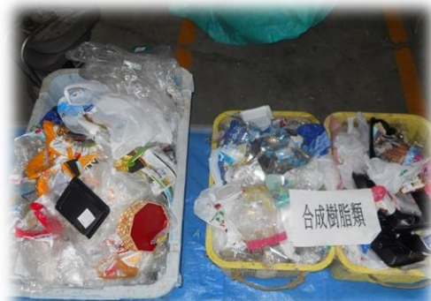
【写真】容器包装プラスチックの混入