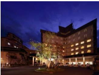
ホテル志戸平(イメージ)