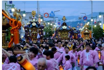
花巻まつり(イメージ)