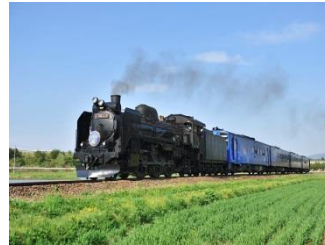
SL銀河(イメージ)