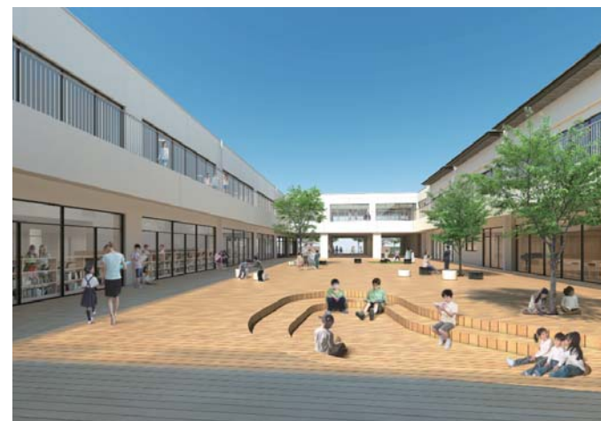
イメージパース：虹色テラスより正門方面を見る