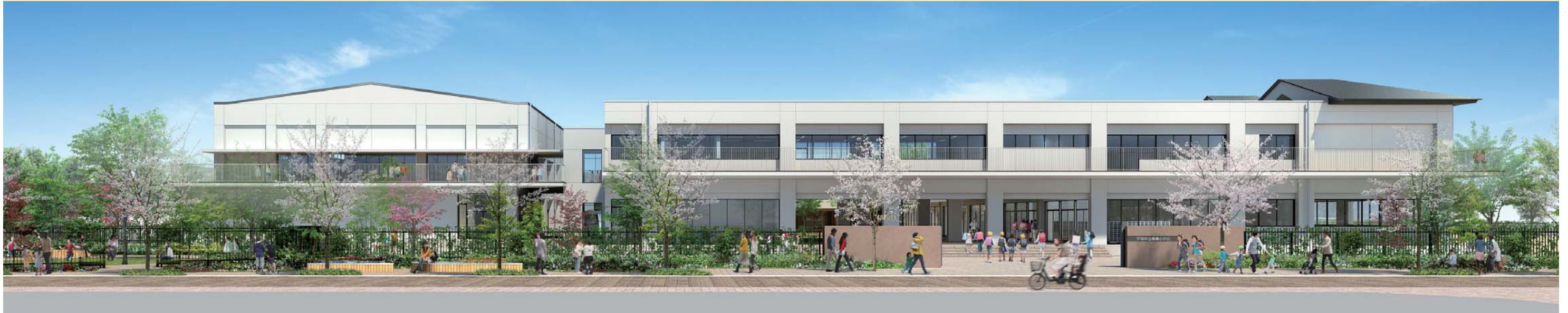
イメージパース：相模小学校の西側全景、シンボルロードより見る。