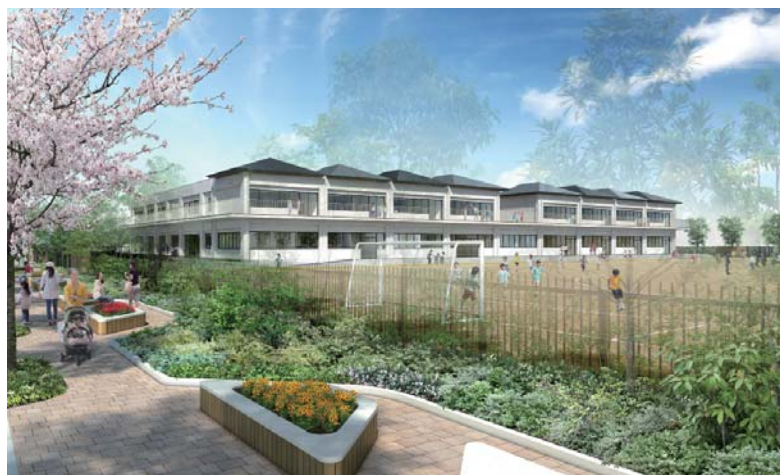
イメージパース：シンボルロードのグリーンベルトから校舎を見る