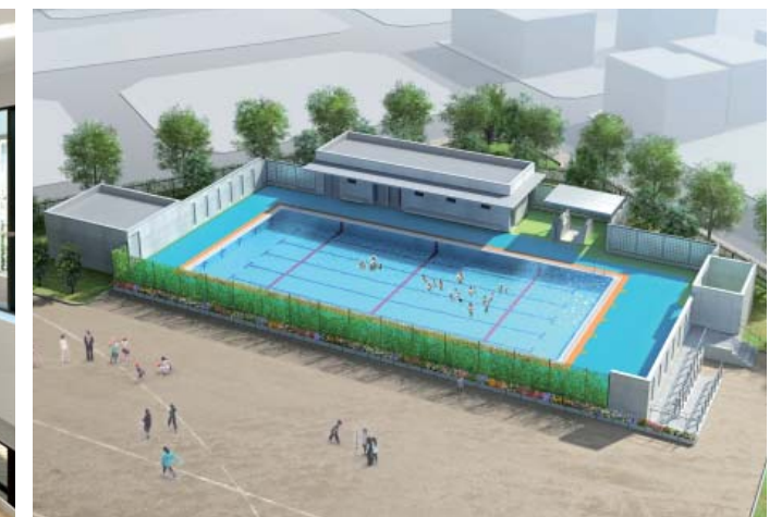
イメージパース：プール棟