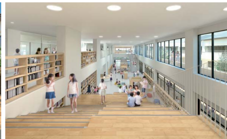
内観イメージパース：2階虹色ひろばより大階段・図書コーナーを見る