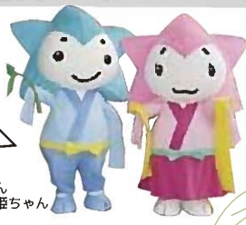
湘南ひこ丸くん ひらつかナナ姫ちゃん