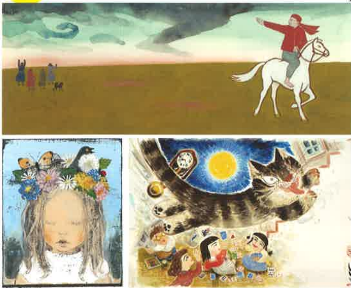
1. 赤羽末吉《スーホの白い馬》BIB1969ノミネート ちひろ美術館蔵 ©Suekichi AKABA 2. 酒井駒子《金曜日の砂糖ちゃん》BIB2005金牌 ©Komako SAKAI 3. 片山健《タンゲくん》BIB1995ノミネート ©Ken KATAYAMA