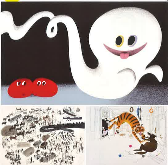
4. 100%ORANGE(及川賢治)《スリスリとパッパ》BIB2015ノミネート ©Kenji OIKAWA 5. ローラ・カーリン《アイアンマン-鉄の男》BIB2015グランプリ Illustrations ©2010 Laura Carlin/ From THE IRON MAN by Ted Hughes, illustrated by Laura Carlin/ Reproduced by permission of Walker Books Ltd, London SE11 5HJ 6. アンネマリー・ファン・ハーリング《ランユキさん モンスターを撃つ》BIB2015金牌