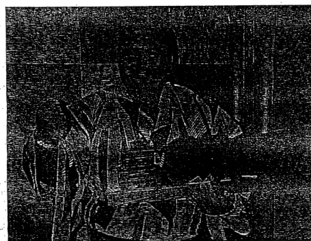
「高砂部屋」の置物を持って、にっこり