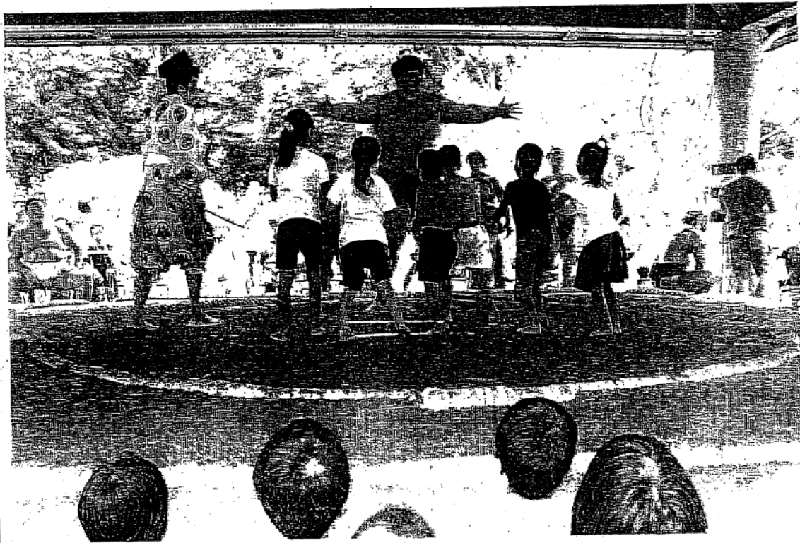
夏合宿に行われた「ちびっ子相撲」で朝弁慶に挑む子ども達

http://www.city.hiratsuka.kanagawa.jp/press/pres20150134.htm