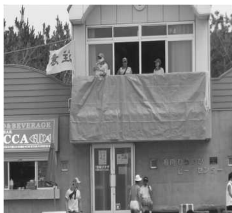
オレンジフラッグによる津波警報の伝達