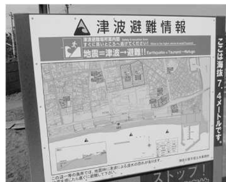
<津波避難情報看板>

オレンジフラッグが掲げられているのを見たら、避難のサイン！すぐに海岸から離れて身の安全を確保しましょう。