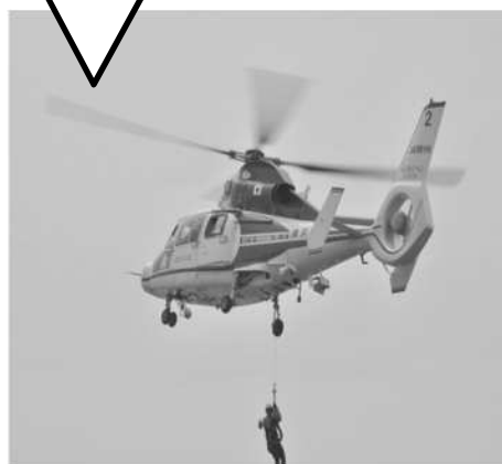
横浜市消防局のヘリコプターによる救出救助

大きな地震が起きたら、まずは高いところへ！経路等を確認しながら、素早く安全な避難を目指して訓練をします。