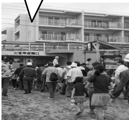
高い場所への避難誘導

海浜利用者に津波警報が発令されたことを、海浜利用者等に音声やオレンジフラッグなどにより周知する訓練をします。