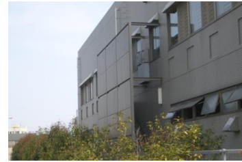
室外機の目隠し。建築物全体のデザインとの調和にも配慮されている。