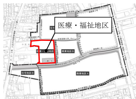
医療・福祉地区の位置

地区の特性を踏まえ、隣接した公園と相まった利用者のやすらぎの場となる空間を目指します。