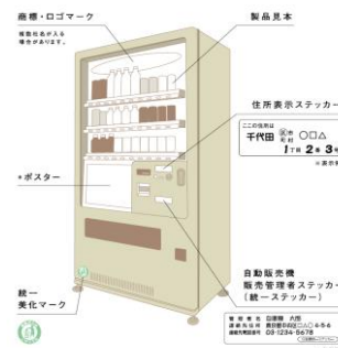
清涼飲料自販機協議会 自販機景観ガイドラインより引用