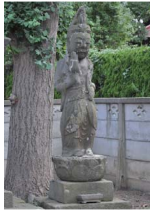
聖観音菩薩 大神観音寺 享保2年(1717) はらみ観音さんと呼ばれ、安産祈願の対象とされました。