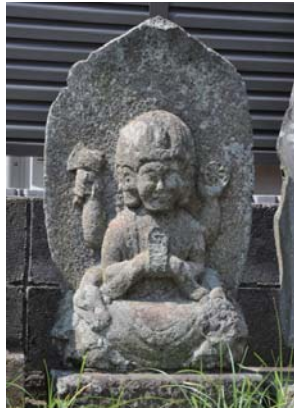
馬頭観音菩薩 南原 路傍 年不詳 馬の供養仏。頭上に馬頭がのり、両手で馬口印を結びます。