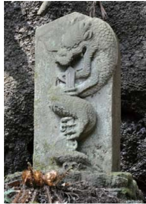
俱利伽羅不動 土屋駒ヶ滝 弘化4年(1847) 不動明王の化身。雨乞いのときには滝壺へ落とされました。