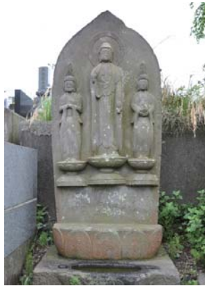
阿弥陀三尊 幸町 海宝寺 延宝3年(1675) 中尊に阿弥陀、脇侍に観音と勢至菩薩をとまっています。