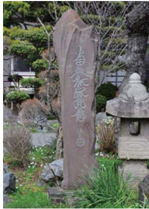
徳本名号塔 豊田宮下 大智寺 天保12年(1841) 徳本上人の南無阿弥陀仏を刻む塔は県内で平塚市が最多。