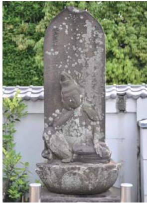
如意輪観音菩薩 大神 正安寺 享保4年(1719) 出産で亡くなった女性を救う血盆経供養に建てられました。