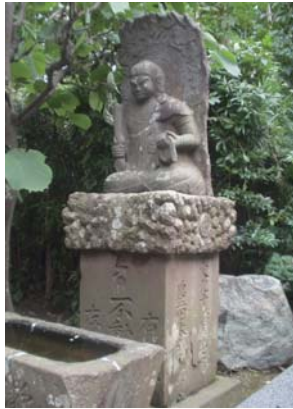
不動明王 豊田本郷 清雲寺 文化10年(1813) お不動さんの台石は、大山・粕屋道の道標になっています。