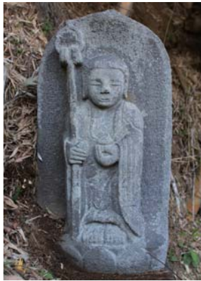
地藏菩薩 上吉沢山の神 万治3年(1660) 基数が最も多い石仏はお地藏さん。錫杖と宝珠をもちます。