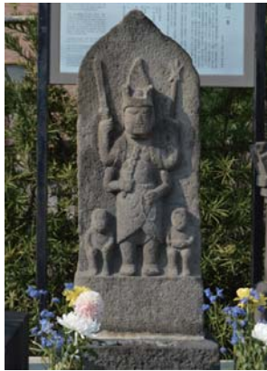
庚申供養塔 札幌町 長楽寺 年不詳 主尊は青面金剛。初期の庚申塔は猿が2匹。県指定文化財。

博物館のサークル・石仏を調べる会は、昭和56年の発足から30年以上にわたり、平塚市内の信仰目的で建てられた石造物を調査してきました。会でくまなく調べあげ、記録した現存する石造物の総数は3058基にのぼります。この度、その集大成として特別展「平塚の石仏～3058の祈りと願い～」を開催します。市内の主な石造物を写真パネルや実物で展示し、3058基の石造物に込められた先人の思いを探ります。